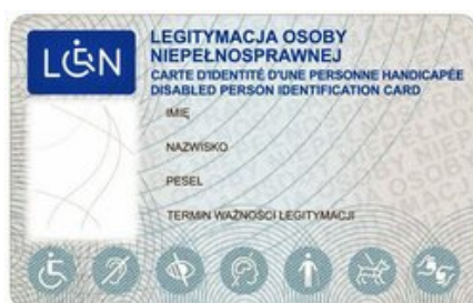
Wzór plastikowej legitymacji osoby niepełnosprawnej AWERS

Opłaty można dokonać za pomocą przelewu internetowego, w banku lub za pośrednictwem operatora pocztowego.