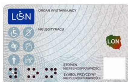
Wzór plastikowej legitymacji osoby niepełnosprawnej REWERS